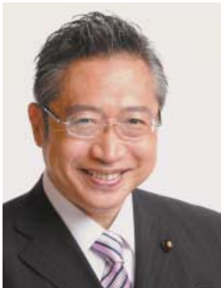
みんなの党代表 渡辺 喜美